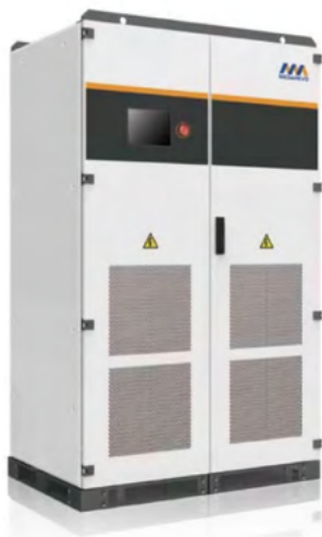
Menič MEGA0500 (ilustračný obrázok)

Batériový rack CATL (ilustračný obrázok racku s osadenými 8 batériovými modulmi) V projekte bude batériový rack osadený 4 batériovými modulmi